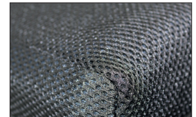
Abnehmbarer Bezug mit Mesh-Gewebe