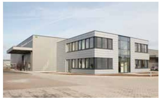
ADL in Amt Wachsenburg (Erfurt)