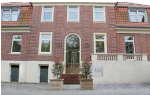
ADL in Münster